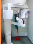
EQUIPO DE RAYOS