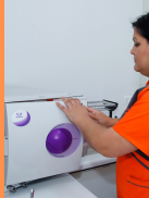
SALA DE ESTERILIZACIÓN